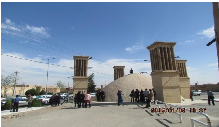
عکس ۲. آب‌انبار واقع در بلوار بسیج

بلوار بسیج در داخل بافت تاریخی احداث شده است. در واقع بلوار آیت‌الله کاشانی و خیابان سلمان فارسی را به هم متصل می‌کند که خیابان سلمان فارسی نیز، خیابانی است که از یک سو، به میدان امیرچخماق منتهی می‌شود. این بلوار، با عرض زیاد خود امکان انتقال سریع و با سرعت وسایل نقلیه را از ابتدا به انتهای خود میسر می‌سازد. از طرف بلوار کاشانی و چهار راه آن، که به داخل بلوار بسج حرکت می‌کنیم، فضاهایی را در دو طرف بلوار مشاهده می‌کنیم. به‌عنوان مثال، در سمت راست ما آب‌انباری خود را نشان می‌دهد که دقیقاً در کنار بلوار است. این آب‌انبار، کارایی خود را همانند بقیه آب‌انبارها از دست داده و فقط در فصولی از سال مسافران و گردشگرانی که از نقاط دیگر می‌آیند، از آن بازدید می‌کنند و عکس یادگار می‌گیرند.