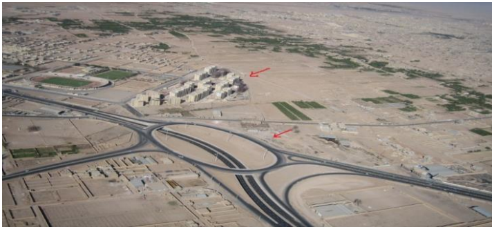
عکس ۴. فضاهای مدرن (خیابان، میدان، آپارتمان)

بر این نکته اتفاق نظر وجود دارد که مدرنیته، یعنی منش و شیوه زندگی امروزی و جدید که به جای شیوه کهن نشسته و آن را نفی کرده باشد. در تعبیری فراتر از اینکه بودلر ارائه کرده، مدرنیته یعنی درک این واقعیت که چیزهایی از زندگی کهنه در زندگی نو باقی مانده‌اند و ما باید با آنها بجنگیم (بهنام و جهاننگلو، ۱۳۸۲، ص ۱۱). این مفهوم، در مسیر تاریخی خود، با مسئله تغییر شکل شهرها و رشد شهرنشینی و پیدایش نهادهای جدید اجتماعی، حضور مردم در عرصه‌های مختلف و ایجاد نظام‌های قانونی همراه شده است (حقیقی، ۱۳۸۱، ص ۱۹). فضاهای کاملاً مدرن در شهر یزد، بیشتر به صورت آپارتمان و یا خانه‌های سازمانی یک یا چند طبقه احداث می‌شود. انبوهی از خانه‌ها، با نمایی معمولاً آجری، که در بعضی موارد از سنگ‌های دیگر هم استفاده می‌شود. عناصر پیونددهنده این فضاها، بیشتر خیابان و بلوار می‌باشد و کوچه نقش کمتری در این پیونددهی دارد. افرادی که در این فضاها ساکن می‌شوند، معمولاً از نقاط دیگر شهر یزد به صورت پراکنده و یا حتی از شهرهای دیگر، به آنجا آمده‌اند. در نتیجه، غیرهمگن بودن و تراکم، از ویژگی‌های مهم این فضاها می‌باشد. امام شهر، آزاد شهر، صفائیه و شهرک‌های اطراف شهر یزد، نمونه‌هایی از این فضاها هستند.